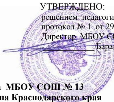
Таблица-сетка часов учебного плана МБОУ СОШ № 13 ст.Калниболотской Новопокровского района Краснодарского края для IV класса на 2013 – 2014 учебный год (БУП -2004)